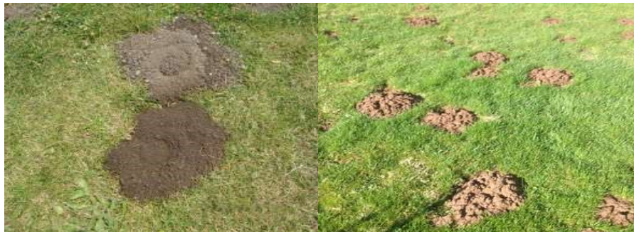
شکل ۱- نشانه‌های لانه سازی موش‌ها در داخل زمین ( http://laundryfaerie.blogspot.com/2010/10/mole.html?m=1 )

موش‌ها از نظر محل زندگی و فعالیت، تقریباً در تمام نقاط زمین به جز مناطق محدودی از قطب‌ها وجود داشته اغلب عادت به لانه سازی، عمدتاً در داخل زمین دارند (شکل ۱). اکثر انواع آن‌ها شب‌ها و تعدادی نیز از طرف روز فعال هستند. برخی از موش‌ها وابستگی زیادی به انسان‌ها دارند و همیشه در اطراف ما دیده می‌شوند. انواعیکه به آن‌ها «جونندگان اهلی» می‌گویند شامل موش خانگی، موش سیاه و موش قهوه‌ای هستند. موش‌ها منبع حدود ۲۰۰ مریضی در انسان و حیوان در سراسر جهان هستند (۱۲). تولید مثل موش‌ها به روش دوجنسه و بسیار زیاد است. آن‌ها به‌طور اوسط سالانه ۴-۷ بار تولید نسل نموده، جنس ماده در هر تولید نسل ۶-۱۷ نوزاد به دنیا آورده و نوزادان درسه ماهگی بالغ می‌گردند (۲،۸). لذا تصور کنید که اگر طبیعت تلفات زیادی به آن‌ها وارد نکند، در مدت کوتاهی جمعیت شان تا چه حد افزایش می‌یابد.