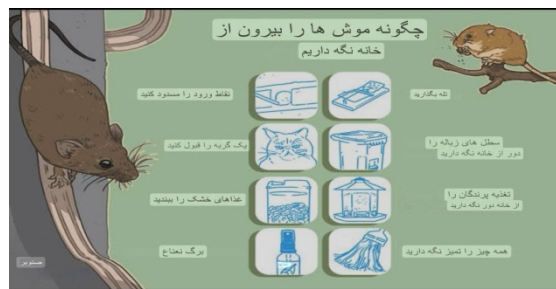
شکل ۶- رات پروفینگ شامل کارهای ساده‌ای است که همیشه باید انجام شوند.

در منازل، ساختمان‌ها، گدام‌ها و سایر انواع ذخیره‌گاه‌ها مسلماً یکی از مهم‌ترین روش‌های مبارزه «رات پروفینگ» است که حتی در صورت استفاده از سایر روش‌های مبارزه بازهم می‌بایست آن را انجام دهیم. رات پروفینگ عبارت از تعدادی روش‌های میخانکی و فزیکتی ساده است که مجموعاً ضمن بهسازی محیط و محل، باعث می‌گردند که از ورود، استقرار، لانه‌گزینی، تولیدمثل، تغذیه و خسارت موش‌ها جلوگیری شود. بستن راه‌های ورود موش‌ها، مرتب‌سازی محیط، دور کردن مواد غذایی از دسترس موش‌ها و غیره از جمله این روش‌ها است (۱۰). لازم به ذکر است که این روش‌ها غالباً بسیار ساده، راحت، ارزان ولی مهم بوده و برحسب محل موردنظر می‌توانند متفاوت باشند (شکل ۶).