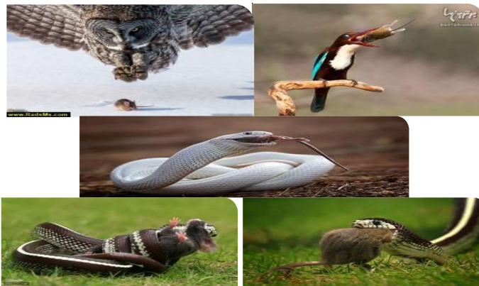
شکل ۷- پرندگان شکاری (بالا) و مارها (پایین) اگر نبوندند جمعیت موش‌ها طغیان می‌کند ( https://encrypted-tbn3.gstatic.com/images?q=tbn:ANd9GcT_aFkQ1z29BxsXUiomRXiwseJHE7L4ggEDsGVMLZyKgMuB_Iqs )

نکته مهمی که در مبارزه بیولوژیکی با موش‌ها باید در نظر داشت اینست که پرورش و رهاسازی دشمنان طبیعی آن‌ها عملاً نه منطقی بوده و نه ممکن است، لذا فقط باید به حفاظت و حمایت از دشمنان طبیعی موش‌ها اهتمام کنیم که همین کار نیز تأثیر خوبی خواهد داشت. شکارچی‌ها اغلب اوقات در کنترل موش‌ها مؤثر هستند، لذا توجه داشتن به آن‌ها در برنامه‌های کنترل بلندمدت بسیار مهم است. از بهترین شکارچی‌ها پشک، شاهین، بوم، کلاغ و مار در اطراف ذخیره‌گاه‌ها به نظر می‌رسد (شکل ۷). نصب یک میله عمودی یا تیرچوبی در ساحه گدام با ارتفاع ۸-۱۰ فوت و عرض ۲-۶ فوت برای نشستن پرندگان شکاری می‌تواند به کنترل بلندمدت موش‌ها کمک کند. مارها نیز از شکارچیان مفید موش‌های کوچک هستند لذا نباید آن‌ها را بی دلیل از بین برد (۳).