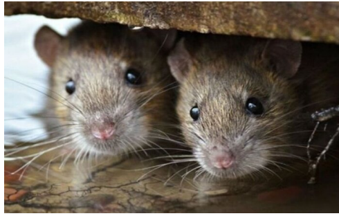
شکل ۵- موش‌ها با شنیدن صدا واکنش نشان می‌دهند

( https://www.animalremover.com/commercial-rodent-removal )