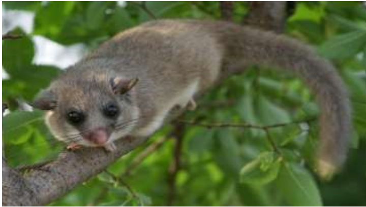
شکل ۳- موش شکول ( https://www.inaturalist.org/taxa/45864-Dryomys/browse_photos )