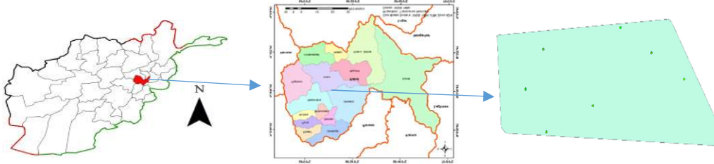
شکل ۱: منطقه مورد مطالعه

پوهنتون کابل، واقع در پایتخت افغانستان بین عرض‌های جغرافیایی 34^{\circ} 30' 47,94676'' تا 34^{\circ} 31' 7,04568'' شمالی و طول‌های جغرافیایی 69^{\circ} 41,12112'' تا 69^{\circ} 27,24036'' شرقی قرار دارد (شکل ۱). ارتفاع منطقه یاد شده از سطح بحر ۱۸۱۳ متر، اوسط درجه حرارت سالانه آن ۱۱،۹۷ درجه سنتی‌گرید و مساحت مجموعی آن ۱۱۶ هکتار می‌باشد.